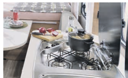
» Praktisch 3 pits gasfornuis