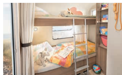
» Stapelbed met 2 bedden of optioneel ook met 3 bedden leverbaar (modelafhankelijk, zie techn.gegevens)