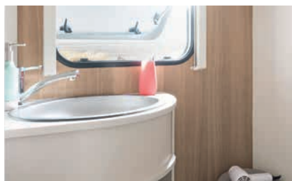
» Fraai vormgegeven wastafel van rvs.