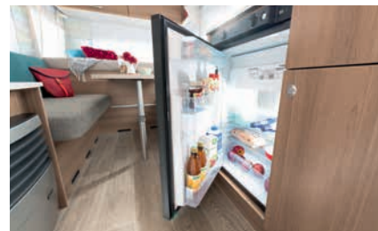
» Koelkast van 81 of 142 l met 10/15 l vriesvak (modelafhankelijk, zie techn. gegevens)