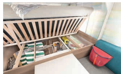
» De latten van de lattenbodem zijn geplaatst in rubber houders. Opklapbaar voor optimaal in- en uitladen.