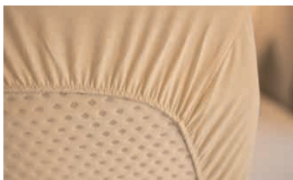
» Koudschuimmatrassen bij alle vaste één- en tweepersoonsbedden